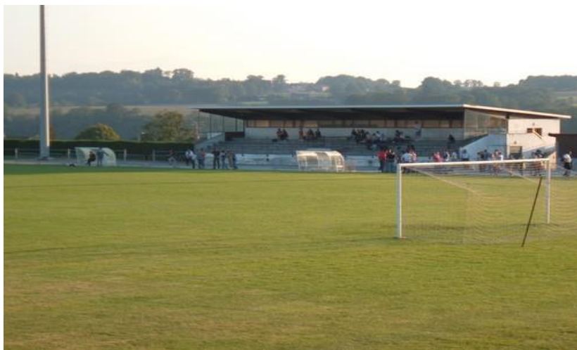
STADE RAYMOND POULIDOR