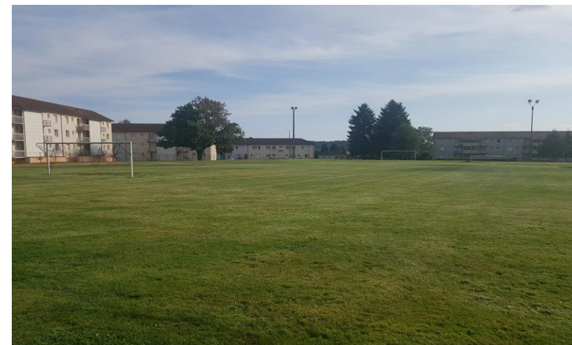
STADE DU BREUIL

Un Halle des Sports, un gymnase et City Stade complètent nos centres sportifs.