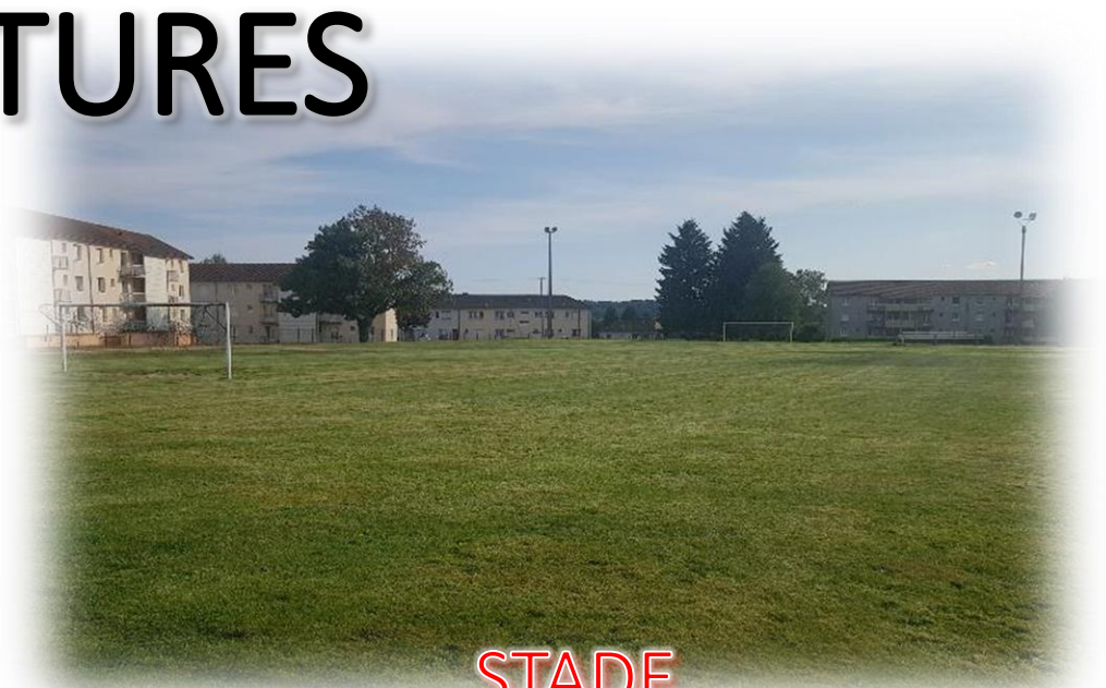
STADE DU BREUIL

Le club de football peut compter sur des infrastructures de qualités comme 2 terrains à 11 (Poulidor et Breuil) + 2 terrains à 8 (Breuil et Augères) Un Halle des Sports, un gymnase et City Stade complètent nos centres sportifs.