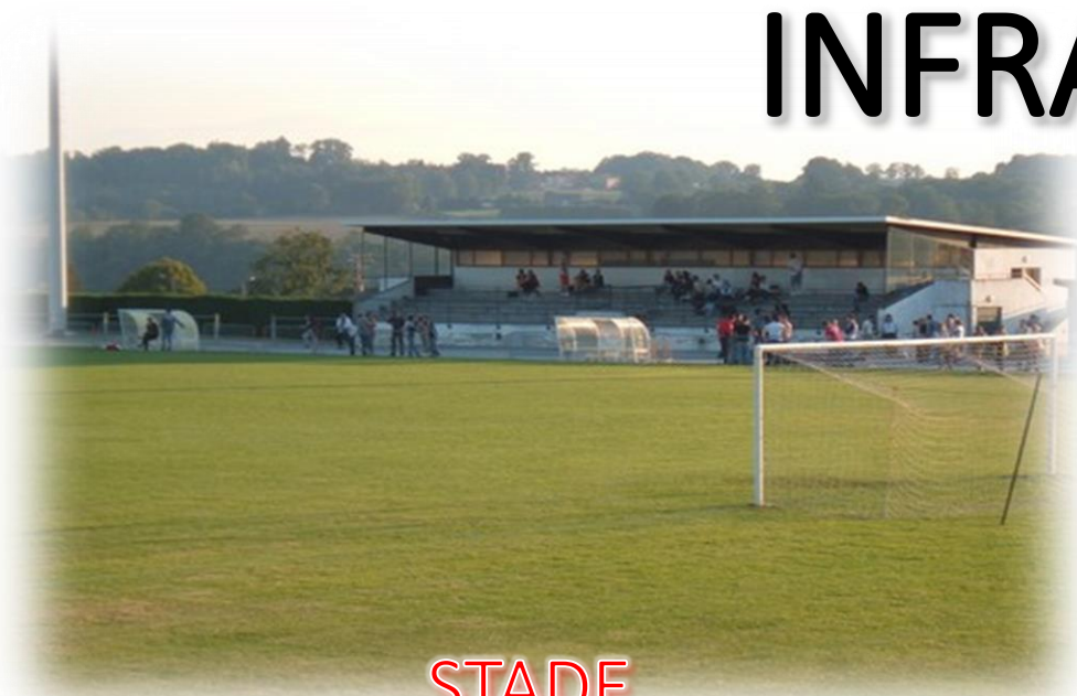
STADE RAYMOND POULIDOR

Le club de football peut compter sur des infrastructures de qualités comme 2 terrains à 11 (Poulidor et Breuil) + 2 terrains à 8 (Breuil et Augères) Un Halle des Sports, un gymnase et City Stade complètent nos centres sportifs.